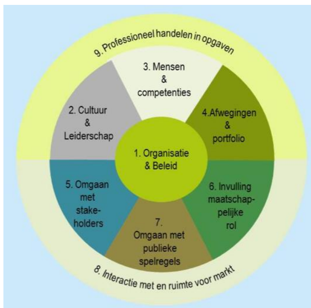
Aspecten van professioneel opdrachtgeverschap (Hermans, Volker, Eisma, & Van Zoest, 2016, p. 3)

Het maturity model publiek opdrachtgeverschap bevat negen voor het opdrachtgeverschap meest relevante thema's waaraan organisaties in ieder geval in onderlinge samenhang aandacht moeten besteden bij het ontwikkelen van hun professionaliteit. Deze negen aspecten zijn in onderstaande 'roos' weergegeven.