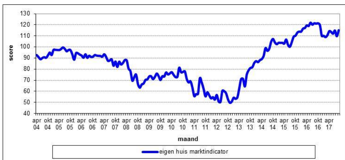
Figuur 2.1 De gemiddelde scores op de Eigen Huis Marktindicator, op maandbasis in de periode april 2004 – september 2017, in Nederland