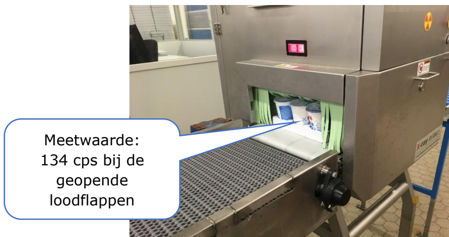
Afbeelding 2.3 – overzicht meetsituatie bij de geopende loodflappen

Wanneer de loodflappen geopend zijn, met de gevulde yoghurtbakjes aanwezig, is het gemeten bruto teltempo ter hoogte van de ingang 134 cps. Een achtergrondmeting geeft 5 cps.