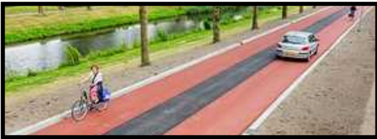
Almere, Gorinchemgracht, duravermeer.nl, 2015