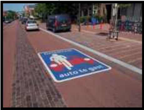
Castricum, Dorpstraat http://fieldoptimizer.nl/projecten/fietsstraat-castricum.html , 2010