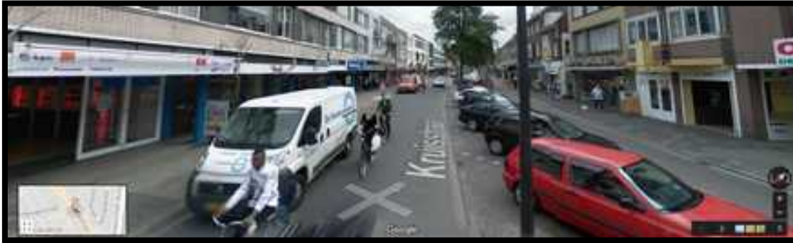
Kruisstraat, augustus 2008