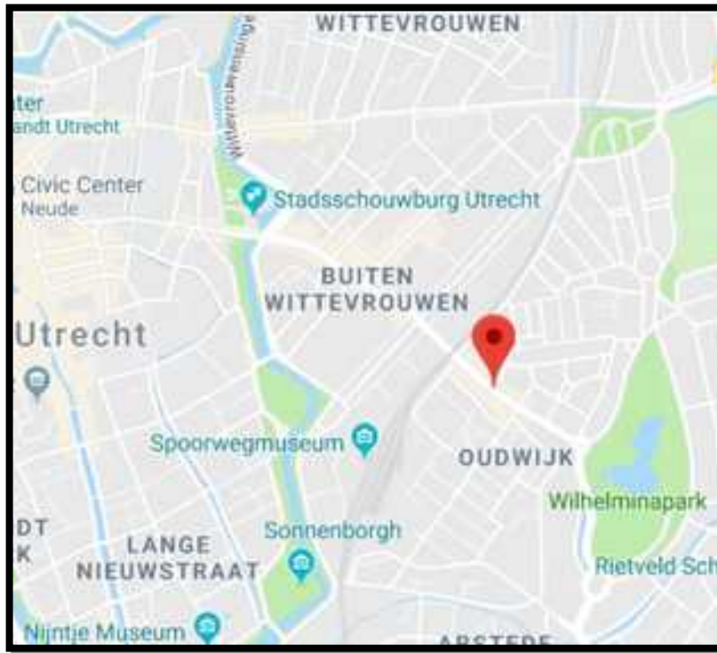
Google Maps, 2018