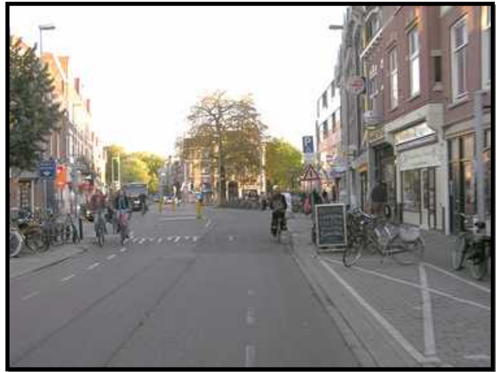
Burgemeester Reigerstraat (Van Werkhoven, 2006)