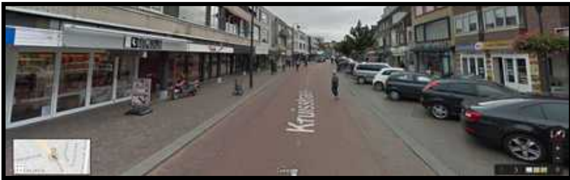
Kruisstraat, oktober 2016