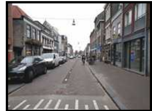
Breda, Bosschstraat, fudainbusiness.nl, 2016