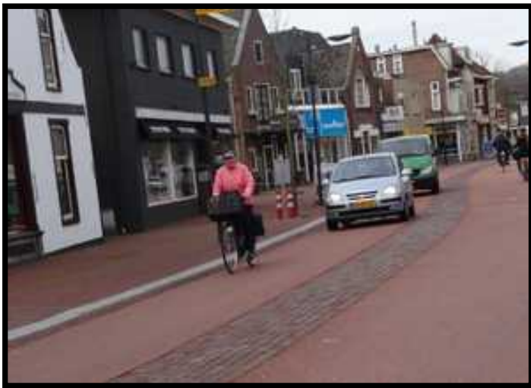
Castricum, verkeerskunde.nl, 2013

Een fietsstraat is een straat waar je voor de auto's fietst in plaats van ernaast.