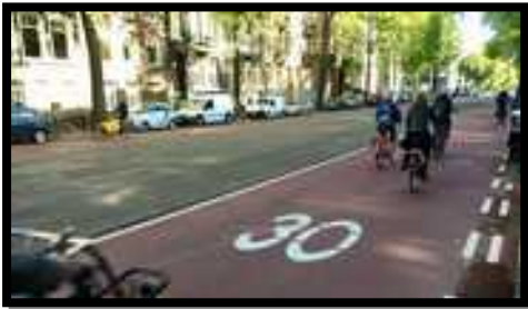
Amsterdam, Sarphatistraat, Amsterdam.nl, 2017