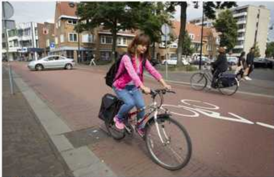
▲ De Kruisstraat Eindhoven