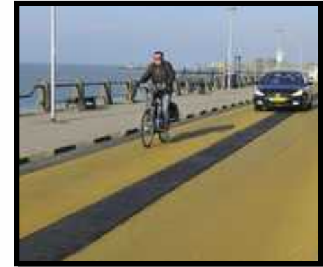
Vlissingen, 2012