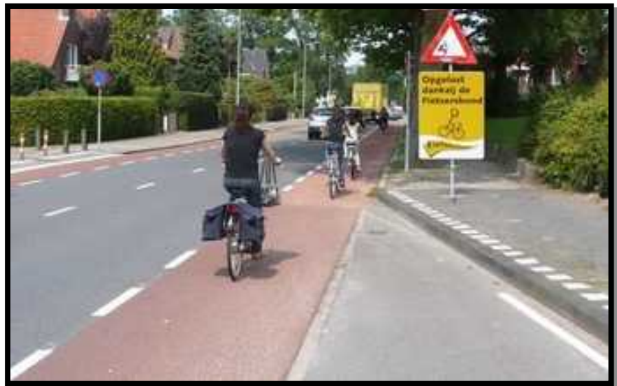
Almelo, fietsersbond.nl, 2012