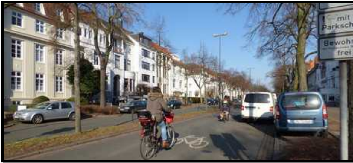
Bremen Bicycle Street (.butenunbinnen.de/, 2017)