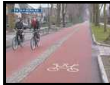
Oss, Hescheweg, fietsberaad, 2003