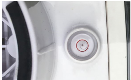
Voorbeeld van een station dat niet goed waterpas staat (de bubbel zit tegen de rechthoek van de cirkel).