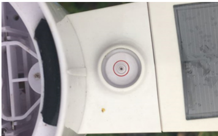
Voorbeeld van een station dat goed waterpas staat.