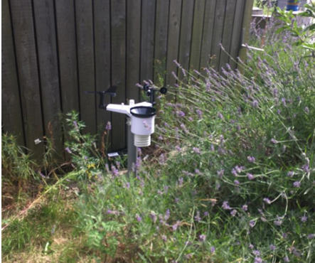
Voorbeeld van station met overhangende takken.