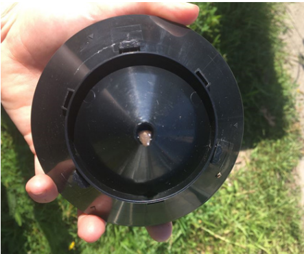
Losdraaien van verstopte trechter.