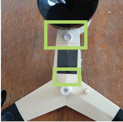
Waterpas & Noordpijl