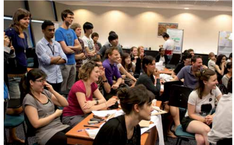
Samenwerkingsproject in Singapore tijdens het Research Project

dan door een groep studenten wordt opgelost door middel van creatieve sessies, gefaciliteerd door studenten. Leden van de studievereniging gaan enkele dagen op tour en doen elke dag een ander bedrijf aan. 'Zowel voor de bedrijven als voor de masterstudenten is het zeer leerzaam.'