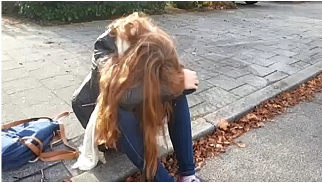
Scène A = 3

Bekijk de verschillende scènes van het filmpje "Tekenmap-netje". Wat denk je dat de juiste volgorde is? Schrijf de juiste nummers bij de letters.