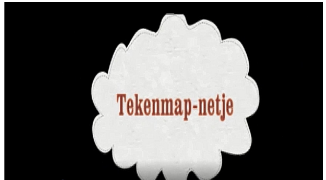
Scène D = 1