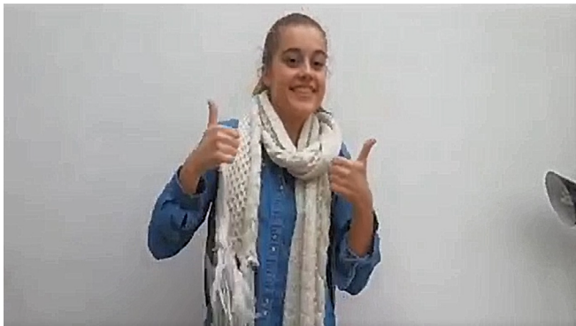
Scène C = 6